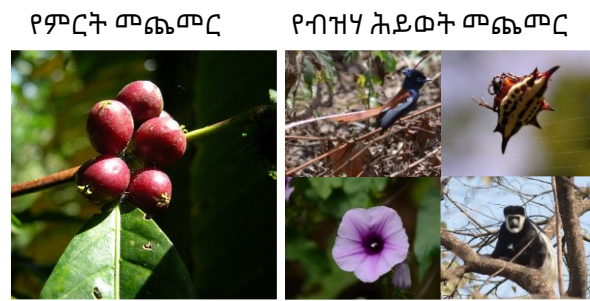
ምስል 3. ከመካከለኛ እስከ ከፍተኛ ምርት የሚሰጡ የቡና እንክብካቤ ዘዴዎች የቡና ምርትን ለመጨመር እና ብዝሃ ሕይወትን ለማሻሻል ዕድሎች ሊኖራቸው ይችላሉ። ዝቅተኛ ምርት ከሚሰጡ የጨካ ቡና ውጭ ባሉ አካባቢዎች ሁሉም ሰው ለዚህ ጥምር ግብ እንዲተጋ ምክራችን ነው።

እዚህ ላይ የብዝሃ ሕይወት እሴቶችንና የቡና አምራቾችን ገቢ እንዴት በአንድነት ማሳደግ እንደሚቻል ዕድሎችን ማሰብ ጠቃሚ ሊሆን ይችላል። የቡና ምርት በተሻለ የማሳ አያያዝ (ቡና መጎንደልን ጨምሮ) ሊጨምር ይችላል። ገበሬዎች ዘላቂ የምርት ስርዓትን በሚያራምዱ ድርጅቶች እዉቅና ከገኙ ምርታቸውን በተሻለ ዋጋ በመሸጥ ገቢያቸው ሊጨምሩ ይችላሉ። የጥላ ዛፍ ዝረያዎችን ቁጥር በመጨመር እና አንዳንድ የእርሻው ክፍሎች የበለጠ ጥቅጥቅ ያለ የጥላ ዛፍ ሽፋን እንዲኖራቸው በማድረግ ብዝሃ ሕይወትን መጨመር ይቻላል።